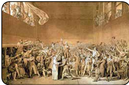
Orduko Frantzez Aberri Batzarra

Frantziako politika maillan, garrantzi aundikoak izan ziran Boltaire, Rousseau, Diderot edo ta Monteskiu, Askatasun, Anaigo edo Senidetan ta Bardintasunezko ikurrakin , borrokatu ziranak, banandutako errigizarte baten aurka, edo jaurkintzazko arlo ezberdiñak banandu zitezen, bakotzaren nortasunezko almenagaz izatezko askatasunean, jaurkintzazko arlo orreik, errigizartearen alde jokatu egien.