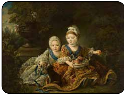
XVIIIIn Luis txikerra, bere anai Luis Augusto Gero XVIIn Luis izando zana, orduaneroaten zan, neskak lez jantzita.

1.771ko urtean Lorailaren 14an XVIIIIn Luisek, Saboyako Maria Josefinagaz (1) eskondu zan, Marie Joséphine´n izenagaz ezagutu zana. Saboyako Biktor Amadeo dukea, gero Zerdeñako errege izango zan IIIIn Biktor Amadeo´ren izenakin, eta bere Borbon´eko Maria Antonia emaztearen alaba zana. Bere anai Frantziko Karlos, XVIIIIn Luisen koñata, Maria Teresagaz ezkonduko zan.