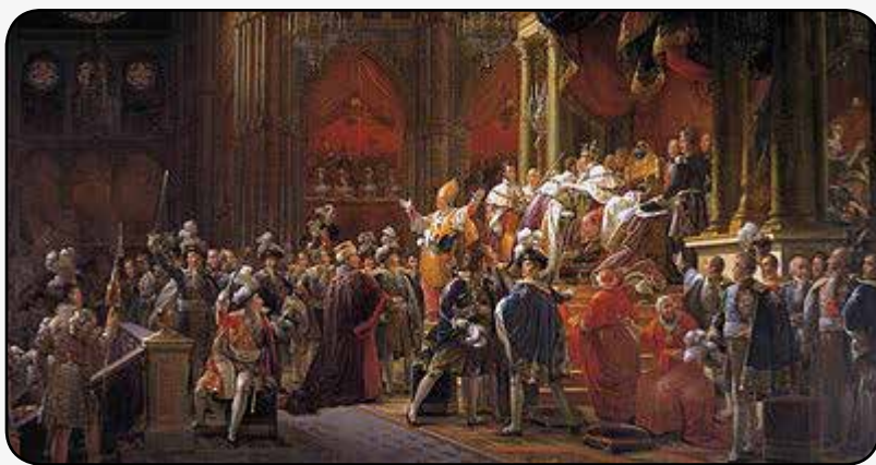
Xn Karlosen koroatzea.

Ertzezko monarkiko auek, gero ta aundiagotzen joan ziran, eta erregearen gaitzaldia aurrera joan zan bitartez, gauza geiagokin arduratzen ebazalako, Artoiseko konde onek artu eban almena aundia izan zan.