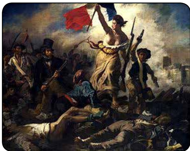
Delakroix' tar Eujenek erritarrak bideratzen.

1.830eko urtean Uztaillaren 27an erri zaiñak, oraindiño zabalik eta lanean egon ziran aldizkarien lantegiak, zarratu ebazan, eta barri ori erritarren artera agertu zanean, erritarrak "Royal Jauretseko" lorategiak ostera artu ebazan, eta Xn Karlos beldar matxinada orregaz, erritarrak bialdu egiezala agindu eutsoen an egon ziran gudariai.