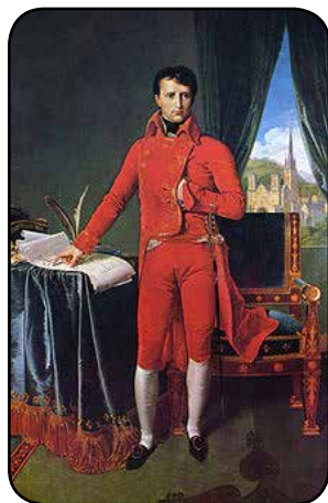
Bonaparte´tar Napoleon, Frantziko jaurkintzaren leen Kontsula.