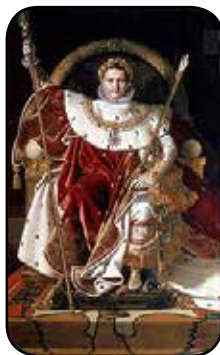
Napoleon, bere kaisertzaren aulkian etarrita Kaisar Jaun lez. 1.806ko urtean Jean Auguste Dominike´k margoztukoa.

Alderantziz Napoleonek, Alemaniako Babiera ta Wütenberg´eko erreñuak ontzat lez artu bear izanda.