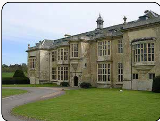
Hartwell House jauregia, XVIII In Luis eta bere gorteak egon ziranak 1.808ko urtetik 1.814ko urterarte