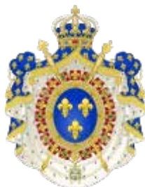
XVIIIIn Luis bera eta bere armaria